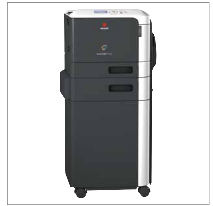
d-COLOR P3100 mit Zusatzlade und Tisch