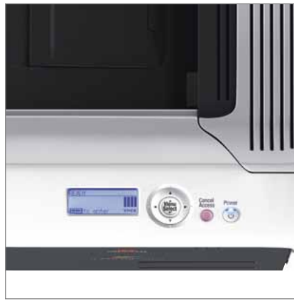
4-zeiliges LCD-Display mit Bediener-Konsole