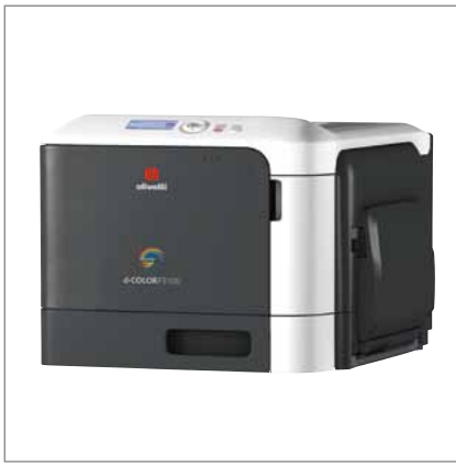
Professioneller Drucker im eleganten Design